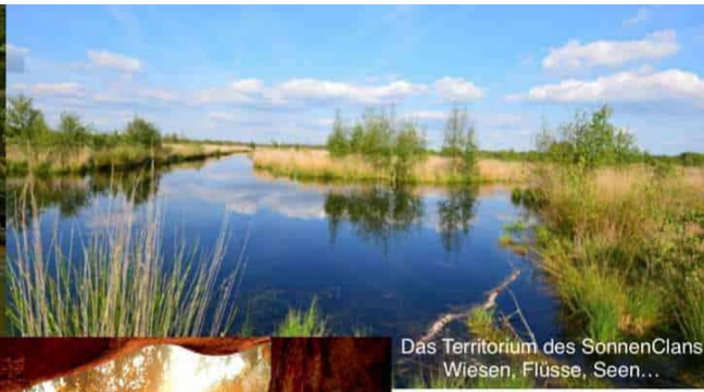
Das Territorium des SonnenClans Wiesen, Flüsse, Seen...