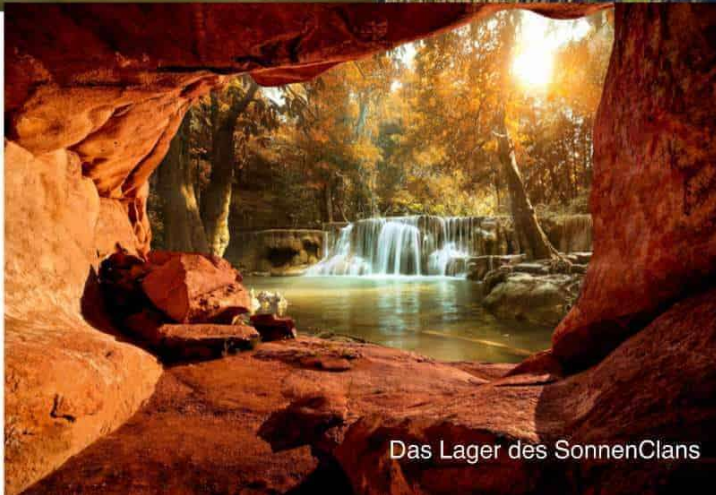
Das Lager des SonnenClans